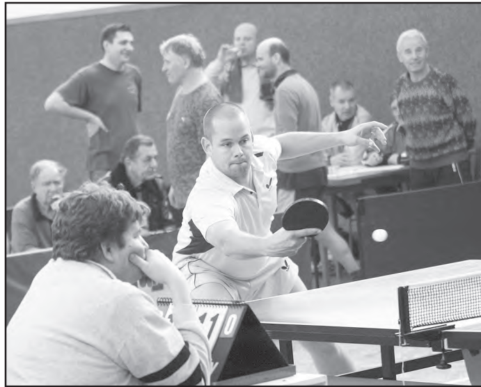
Dne 23. září v 16 hod. v herně České pošty (vchod z Horní České) pořádá vedení Městské ligy stolního tenisu Znojmo zahajovací schůzku vedoucích družstev. Účast všech vedoucích, nebo jejich zástupců, je nutná. Děkuji - Jif Fiala.